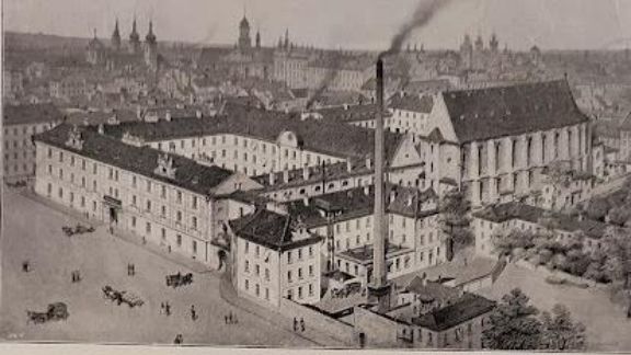
DER ANSAROF IM UMKREIS DER ALTSTADT.