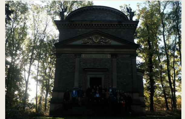
Hrobka rodiny Doubků